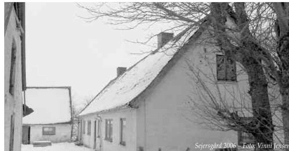
Sejersgård 2006