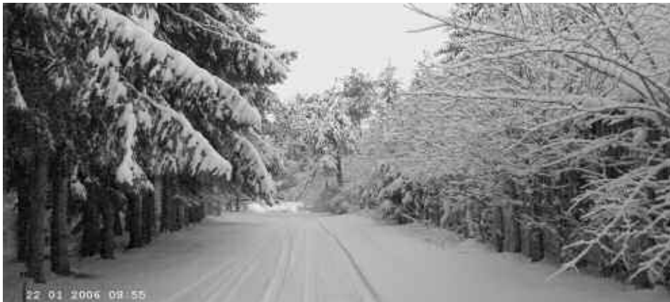
Assentorp i smuk vinterdragt

Vi har i år flyttet vores sædvanlige cykel- og ægtrilletur fra palmsøndag til søndag den 28. maj .