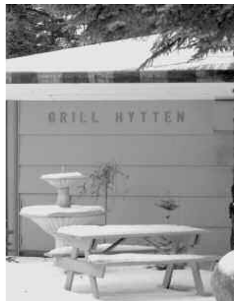
Snefotos fra Campingpladsen i dag

Vi kan også bruge forhandlere af Tubberware, tøj, kosmetik, læder o.a., som kunne have lyst til at holde et »party« hos os.