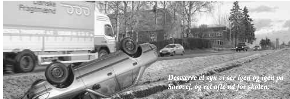
Desværre et syn vi ser igen og igen på Sorøvej, og ret ofte ud for skolen.

Omfartsvejen kan føres øst eller vest om Stenmagle. Fordelen ved en østlig omfartsvej er, at det er den korteste linjeføring. Til gengæld skal en østlig omfartsvej krydse 3 eksisterende veje – Præstelyngen, Mejerivej og Ostrupvej, hvor mange skolebørn har deres daglige færden. Denne løsning vil derfor stille krav til bygning af tunneler og gangbroer o.lign., for at opnå en sikker krydsning af omfartsvejen. Alternativt kan omfartsvejen føres vest om Stenmagle, hvor byens industrikanter er placeret. Fordelen ved denne linjeføring er derudover at omfartsvejen kun vil krydse 1 eksisterende vej – Stenmaglevej.